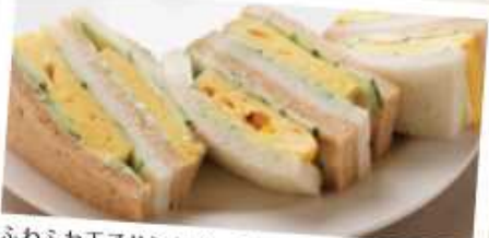
ふわふわ玉子サンドイッチ 500円 Baked egg sandwiches ふわふわに焼きあげた玉子ときゅうりをサンドしました。