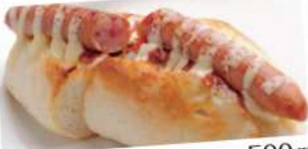
特製ホットドック 500円 Special-made hot dog ソーセージとサルサソースが絶妙にマッチした人気の一品です。