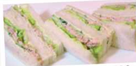
ツナサンドイッチ 500円 Tuna sandwiches ツナとレタスときゅうりをサンドしました。