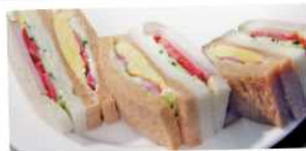
ミックスサンドイッチ 500円 Assorted sandwiches 厚切りハムと焼き玉子に野菜がたっぷり入っています。