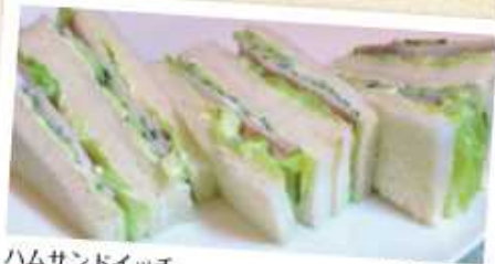
ハムサンドイッチ 500円 Ham sandwiches ロースハムとレタスときゅうりをサンドしました。