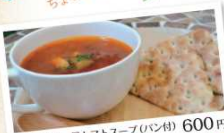
ラタトゥイユ風トマトスープ(パン付) 600円 Ratatouille-style tomato soup (with bread) ズッキーニ、ピーマン、玉葱、茄子が入ったトマトスープです。