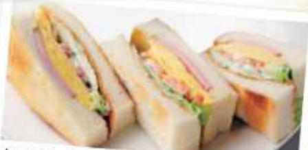
ホットミックスサンドイッチ 550円 Baked mix sandwiches 焼き玉子と厚切りハムをサンドしたサンドウィッチです。