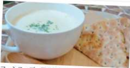
コーンスープ〜豆乳仕立て〜(パン付) 600円 Corn soup - Soy milk (with bread) 豆乳を使った、さらっとした味わいのコーンスープです。