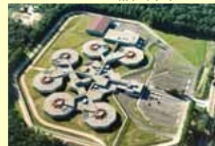
カナダ Central North 刑務所