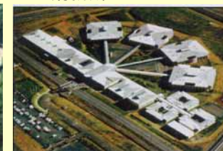
オーストラリア Junee 刑務所