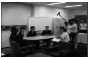
↑ 2008年度は取材も受けました