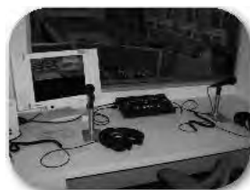
← ↑ 大阪大学から訪問