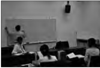
← 2009年度 →