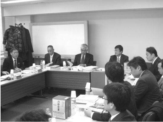
草案検討会の様子

の裁判所を訪問するなど、ベトナム民事訴訟に関して精力的に研究しておられる。このような研究活動を、今後のベトナム法整備支援の中でも存分に活かしてくださるものと確信している。