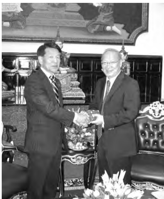
(谷政務官(左)とアン・ヴォン・ワッタナー司法大臣(右))

民法適用を控えた2011年12月19日、日本から谷博之法務大臣政務官がカンボジア司法省を訪れ、アン・ヴォン・ワッタナー司法大臣に対して、民法適用につき、お祝いの言葉を申し上げます。司法大臣からは、今後について「民法の適用及び実施、普及が成功するよう努力したい。司法省を含め裁判官、検察官、弁護士らの人材育成が最優先課題である。」との意気込みが示されました。