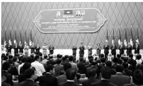
(2011年12月21日開催の民法適用記念式典)

昨年（2011年）12月21日、いよいよカンボジア民法が適用となりました 1 。1999年3月、カンボジア司法省をカウンターパートとして、JICAの法制度整備支援プロジェクトが開始されて以降の、日本・カンボジア両国関係者の12年余りの心血を注いだ努力がようやく結実しましたので、その御報告をいたします。