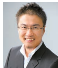
乙武 洋匡氏 (作家、東京都教育委員)