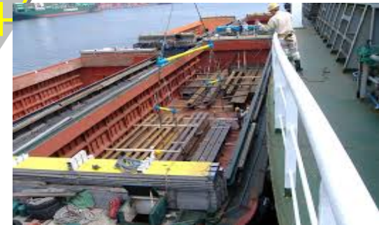
船舶からはしけへ貨物を積み替える様子