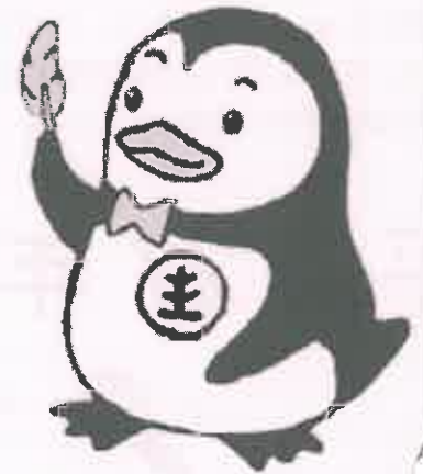
更生ペンギンのホゴちゃん

住民の皆様が、少年非行の実態を認識して、地域環境の浄化に心がけるとともに、罪を犯した人たちや非行をした少年の立ち直りを温かい目で見守りつつ、援助の手をさしのべ、明るい社会を作りましょう。