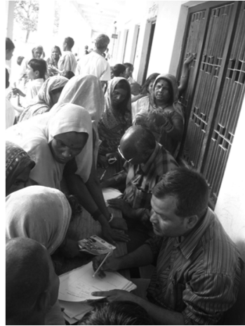
ネパールにおけるリーガルエイド(法律扶助)支援所