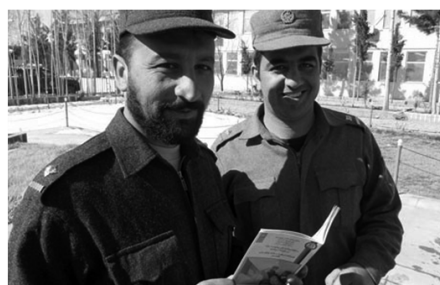
「行動規範」に関する小冊子を読むアフガニスタンの国家警察官