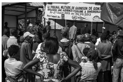
コンゴ民主共和国東部のゴマ市における軍事裁判