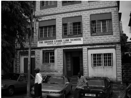
シエラ・レオネのロースクール