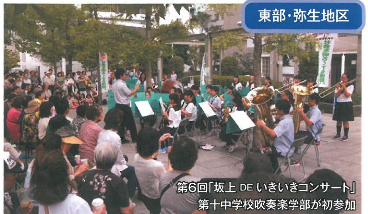
第6回「坂上 DE いきいきコンサート」 第十中学校吹奏楽学部が初参加