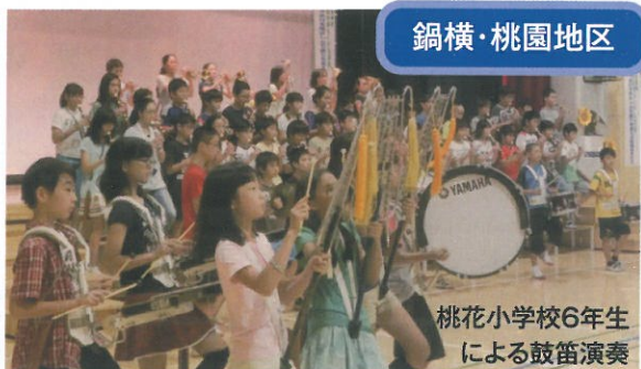
桃花小学校6年生 による鼓笛演奏