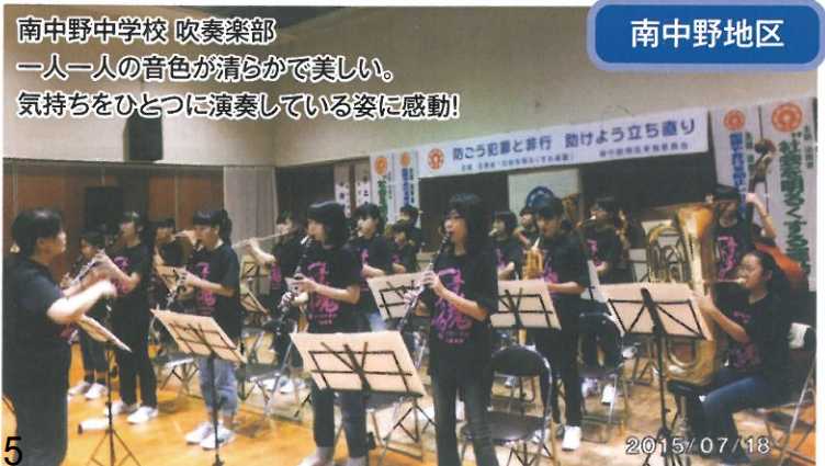
南中野中学校 吹奏楽部 一人一人の音色が清らかで美しい。 気持ちをひとつに演奏している姿に感動!