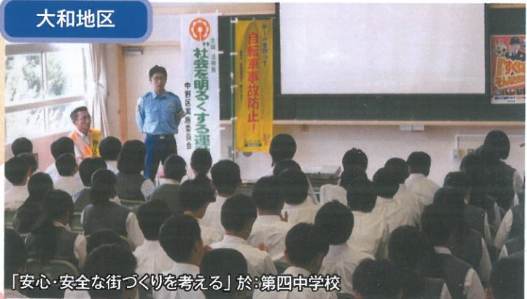
「安心・安全な街づくりを考える」於:第四中学校