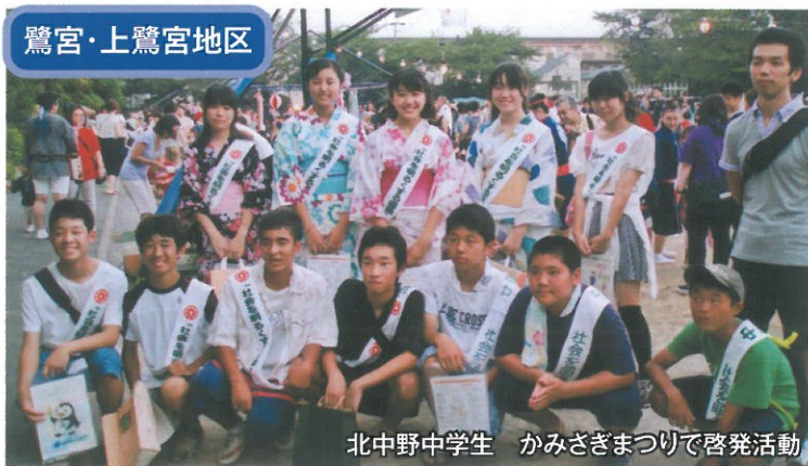
北中野中学生 かみざぎまつりで啓発活動