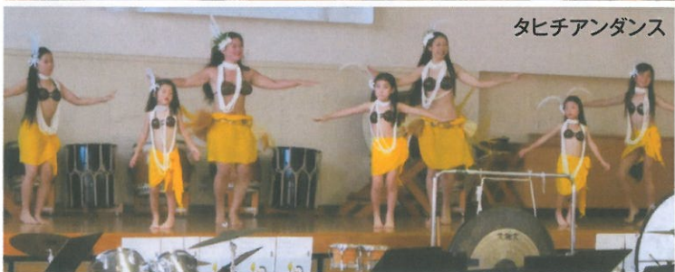
タヒチアンダンス

法務省主催 第65回 中野区保護司会 社会を明るくする運動 江古田地区推進委員会 江古田地区 夏フェスタ