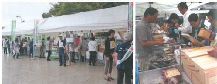
↑「キャピック」も加わり刑務所作業作品の販売!! どれにしようかな～