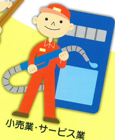
小売業・サービス業