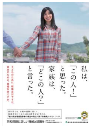
平成27年度同和問題啓発ポスター(制作:香川県) 平成28年度人権啓発資料法務大臣表彰 ポスター部門 優秀賞 受賞作品