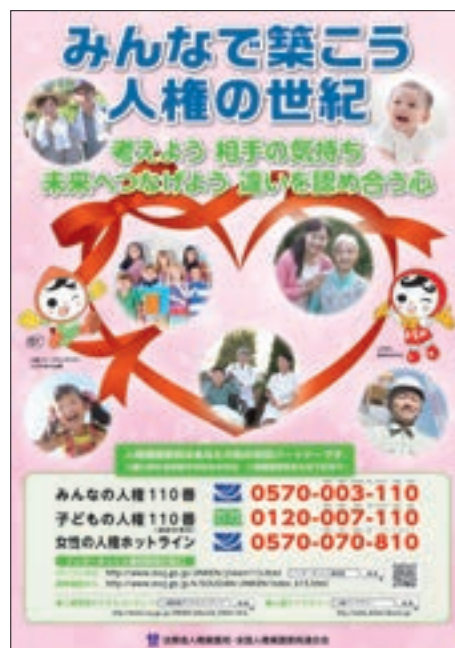
ポスター「平成29年度啓発活動重点目標」