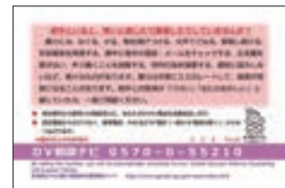
DV相談ナビカード（裏面）

ウ 「平成29年におけるストーカー事案及び配偶者からの暴力事案等への対応状況について」（警察庁）によれば、平成29年中のストーカー事案の被害者は女性が約9割を占めている。