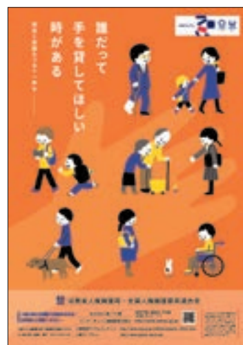
ポスター「障害のある人の人権について考えよう！人権ポスターキャッチコピーコンテストの最優秀作品を素材としたポスター」