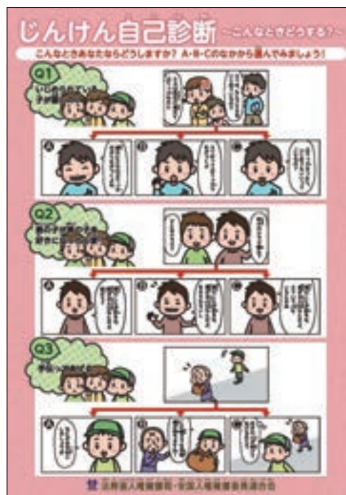
リーフレット 「じんけん自己診断～こんなときどうする？」 (小学生用)