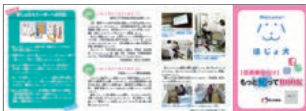
パンフレット 「医療機関向け ほじょ犬 もっと知ってBOOK」