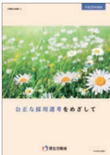
パンフレット 「公正な採用選考をめざして」