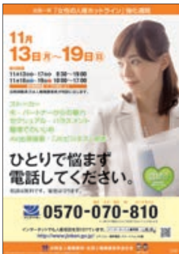
ポスター 「女性の人権ホットライン強化週間」