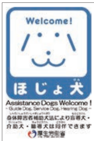
ステッカー 「ほじょ犬」

イ 厚生労働省では、「身体障害者補助犬法」（平成14年法律第49号）の趣旨及び補助犬の役割等についての一層の周知を目的として、ポスター、パンフレット、ステッカー等の作成・配布や、ホームページ（ http://www.mhlw.go.jp/topics/bukyoku/syakai/hojyoken/ ）の開設を行っている。