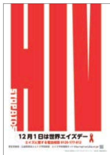
ポスター 「平成29年度『世界エイズデー』」

最優秀作品を世界エイズデーキャンペーンポスターのデザインに採用し，全国各地で掲示することにより，HIV・エイズについて理解を深めてもらうよい機会となっている。