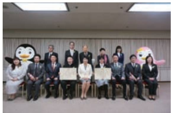
第67回“社会を明るくする運動”作文コンテスト法務大臣賞表彰式の様子