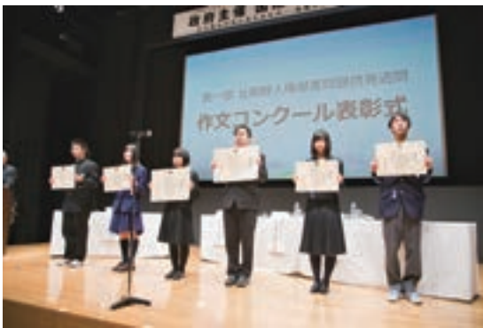
作文コンクール表彰式