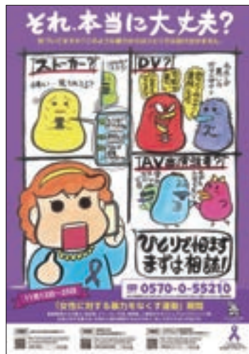
ポスター 「女性に対する暴力をなくす運動」