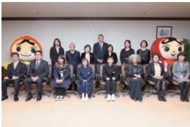
受賞者とその御家族