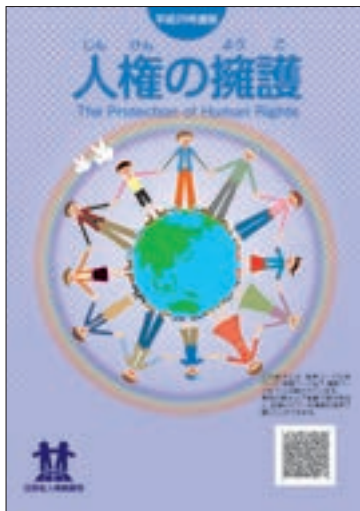
啓発冊子 「平成29年度版 人権の擁護」