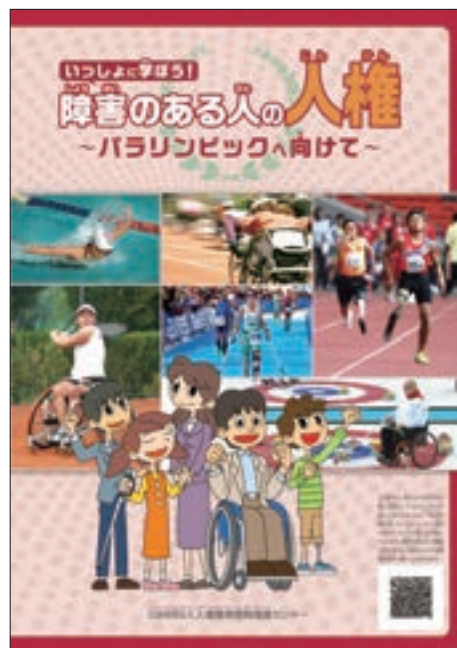
啓発冊子「いっしょに学ぼう！障害のある人の人権～パラリンピックへ向けて～」

加えて，2020年東京パラリンピック競技大会の開催に向けた取組の一つとして，経済3団体を中心に設立された「オリンピック・パラリンピック等経済界協議会」と連携し，車椅子体験，パラリンピアンによる講話，障害者スポーツ体験（ボッチャ，車椅子バスケットボールなど）などと，障害のある人の人権や「心のバリアフリー」について人権擁護委員が話をする人権教室を組み合わせた啓発活動を実施している。