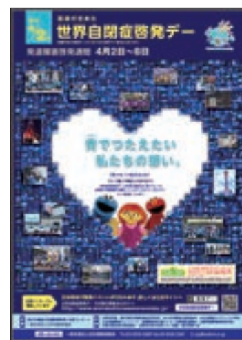
ポスター「世界自閉症啓発デー」