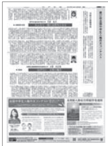
神戸新聞 平成29年12月4日付け掲載 全国中学生人権作文コンテストに関する新聞記事