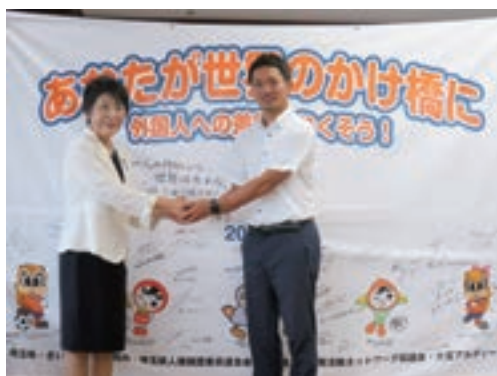
上川法務大臣メッセージ

法務省の人権擁護機関では、いじめの防止等の人権尊重思想を若年層に普及させるため、フェアプレーの精神等をモットーとし、青少年層や地域社会において世代を超えた大きな影響力を有するJリーグ加盟クラブ、プロ野球球団等のスポーツ組織と連携・協力を行っており、スタジアムにおける各種啓発活動、人権スポーツ教室や1日人権擁護委員イベントへの選手派遣等、ファン・サポーターへの人権啓発において連携を図っている。