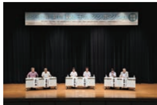
ハンセン病に関する「親子のシンポジウム」（那覇会場）