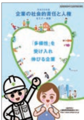
パンフレット「平成28年度『企業の社会的責任と人権』セミナー概要」

また、併せて、企業の社会的責任や情報モラルに係る啓発活動の参考となるべきパンフレットを経済団体や企業等に配布した。