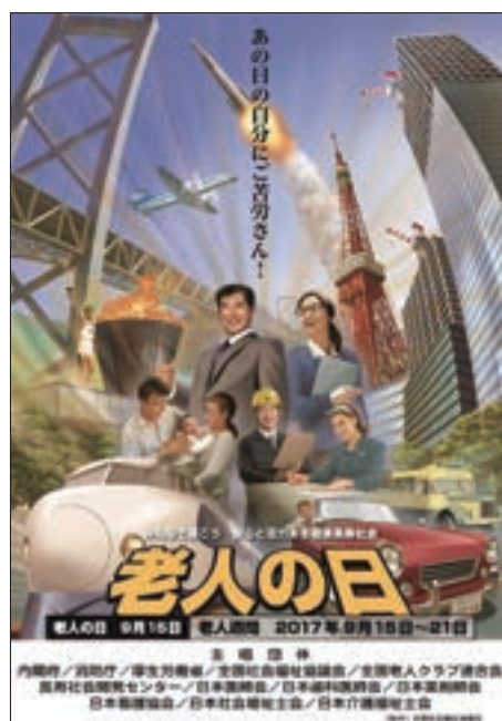
ポスター「老人の日・老人週間」

さらに、腹話術師のいっこく堂氏によるスポット映像「高齢者を大切にしよう」をYouTube法務省チャンネルで配信している。