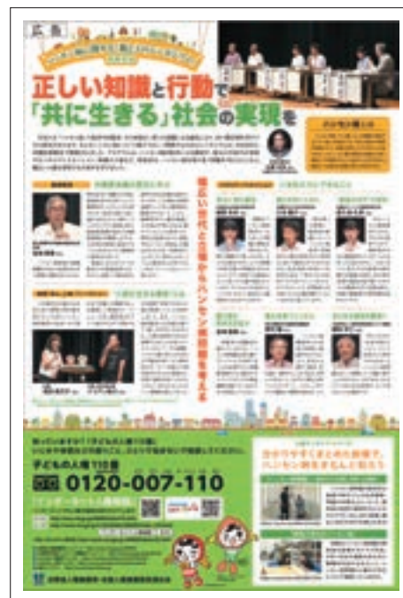
ハンセン病啓発広告 （読売中高生新聞）