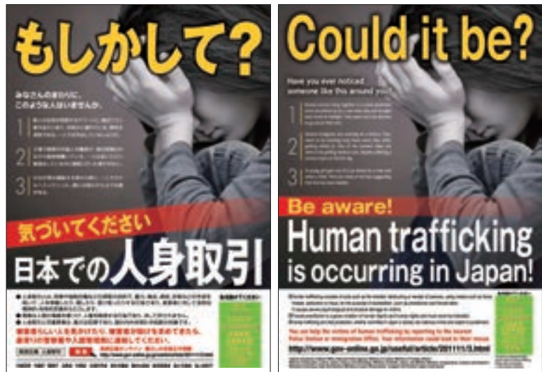
ポスター「人身取引対策」

合は、人権侵犯事件として調査を行い、事案に応じた適切な措置を講ずることとしている。