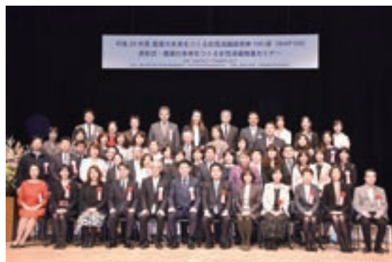
平成29年度農業の未来をつくる女性活躍経営体100選(WAP100)表彰式

(毎年3月10日)にちなんで、3月上旬に地方公共団体、農林水産関係女性団体等による会議等が開催されるとともに、農業の未来をつくる女性活躍経営体100選(WAP100)表彰式、未来農業DAYs(農山漁村女性活躍表彰及び大地の力コンペ)及び農業女子PJフォーラム2017を行うなど、男女共同参画に関する気運の醸成に努めた。