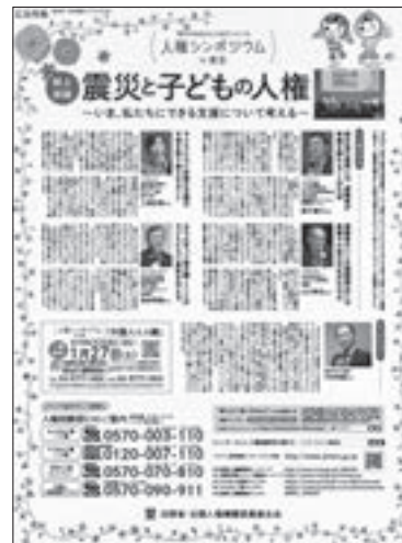
人権シンポジウムに関する新聞記事・啓発広告（朝日新聞）