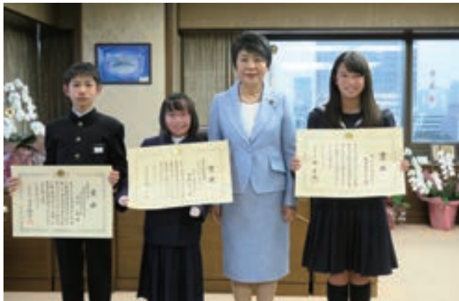
第37回全国中学生人権作文コンテスト中央大会表彰式

さらに、優秀作品を世界に発信することを目的として、第37回大会の優秀作品3作品について、英語に翻訳の上、コンテストの紹介文と共に法務省ホームページ（英語版）に掲載した。