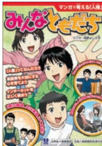
啓発冊子 「マンガで考える『人権』 みんなともだち」