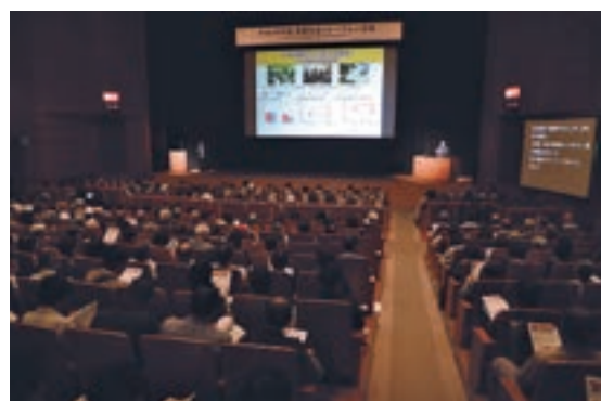
高齢社会フォーラム

内閣府では、高齢者の社会参加や世代間交流を促進するため、平成29年10月に宮崎市、平成30年1月に東京都千代田区において、「高齢社会フォーラム」を開催するなどの事業を実施した。