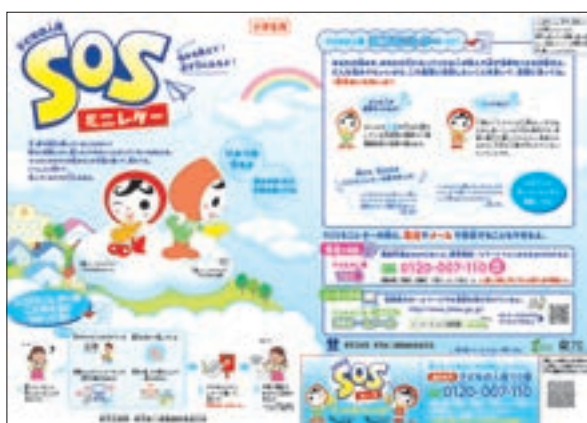
子どもの人権SOSミニレター (小学生向け)

子どもの人権110番を端緒に人権侵犯事件として立件し救済措置を講じた具体例は、以下のとおりである。