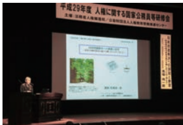
人権に関する国家公務員等研修会

ア 法務省では、中央省庁等の職員を対象とする人権に関する国家公務員等研修会を開催している。平成29年度は、東京都港区において、次のとおり2回開催し、合計853人が参加した。