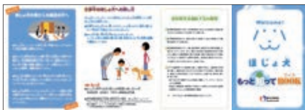
パンフレット 「ほじょ犬 もっと知ってBOOK」