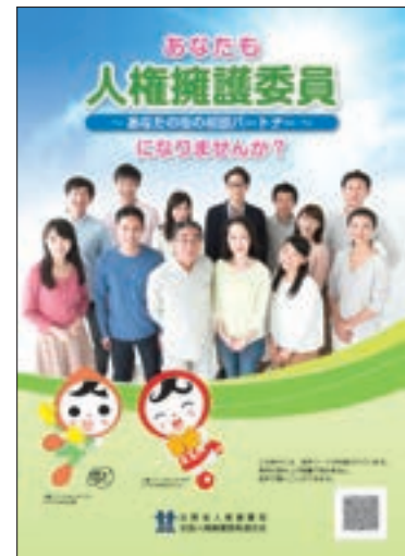
冊子 「あなたも人権擁護委員～あなたの街の 相談パートナー～ になりませんか?」