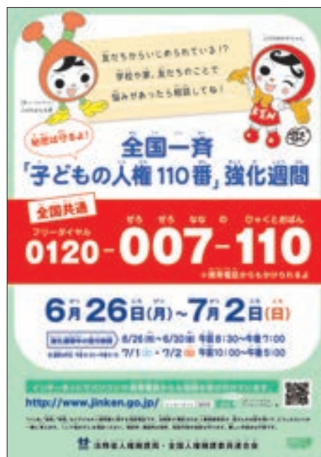
ポスター「子どもの人権110番強化週間」

また、児童買春、児童ポルノによる被害等の人権問題についても、人権相談に応じており、人権相談等で、人権侵害の疑いのある事案を認知した場合は、人権侵犯事件として調査を行い、事案に応じた適切な措置を講じている。