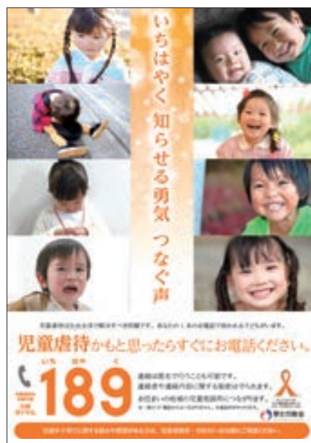
ポスター「児童虐待防止の推進」

平成29年度は、「いちはやく 知らせる勇気 つなぐ声」を月間標語として決定し、児童虐待防止対策協議会の開催（11月22日）、広報用ポスター、リーフレット等の作成・配布、政府広報の活用等により、児童虐待は社会全体で解決すべき問題であることを周知・啓発した。また、児童虐待防止の啓発を図ることを目的に民間団体（認定NPO法人児童虐待防止全国ネットワーク）が中心となって実施している「オレンジリボン運動」を後援している。