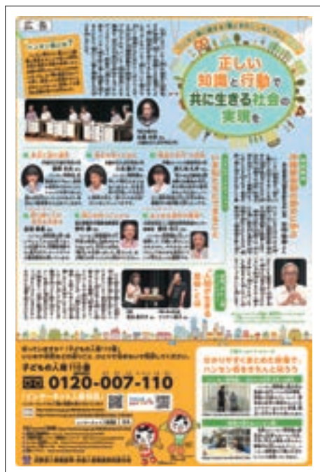
ハンセン病啓発広告 （読売KODOMO新聞）