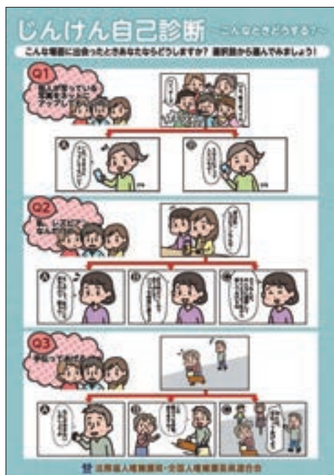
リーフレット 「じんけん自己診断～こんなときどうする？」 (一般用)