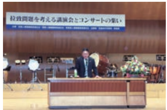
拉致問題を考える講演会とコンサートの集い