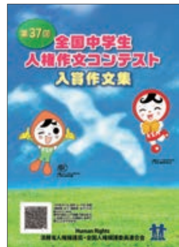
第37回全国中学生人権作文コンテスト入賞作文集