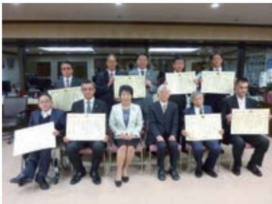
平成29年度人権擁護功労賞