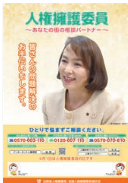
ポスター「人権擁護委員制度」

(注)「特設人権相談所」は、法務局長又は地方法務局長と人権擁護委員協議会会長が、協議の上、日時及び場所を定めて開設する相談所をいい、土曜日、日曜日又は祝日に法務局・地方法務局及びその支局で開設するものや、デパート、公民館、福祉施設等で開設するものがある。