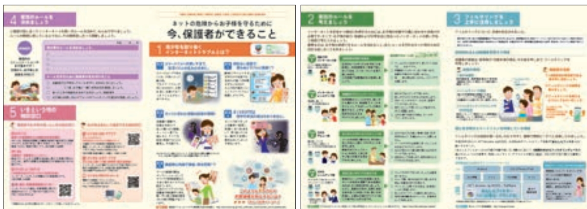
リーフレット「ネットの危険からお子様を守るために今、保護者ができること」