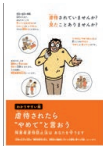
パンフレット「わかりやすい障害者虐待防止法パンフレット」

また、平成29年3月には、教育委員会や学校、保護者等に向けた「発達障害を含む障害のある幼児児童生徒に対する教育支援体制整備ガイドライン」を策定し、公表した。