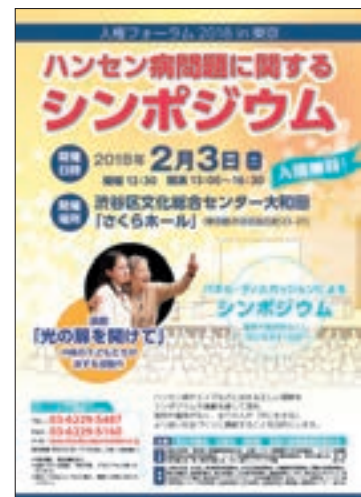
ハンセン病問題に関するシンポジウム（リーフレット）