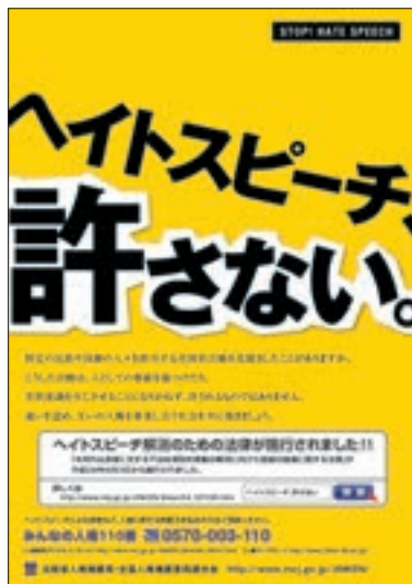
ポスター 「ヘイトスピーチ、許さない。」

ア 法務省の人権擁護機関では、ヘイトスピーチに焦点を当てた啓発活動として、これまでの「外国人の人権」をテーマにした啓発に加え、各種媒体により、こうしたヘイ