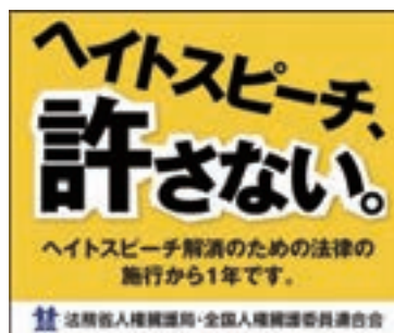
インターネット広告 「ヘイトスピーチ、許さない。」