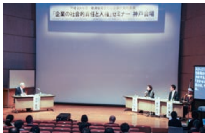
平成29年度「企業の社会的責任と人権」セミナー