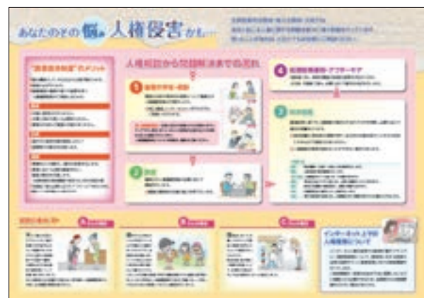
リーフレット 「法務局による相談・救済制度のご案内」