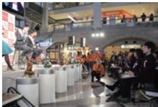
1日人権擁護委員イベントでの啓発活動