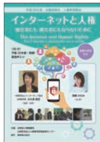
啓発ビデオ「インターネットと人権～加害者にも被害者にもならないために～」