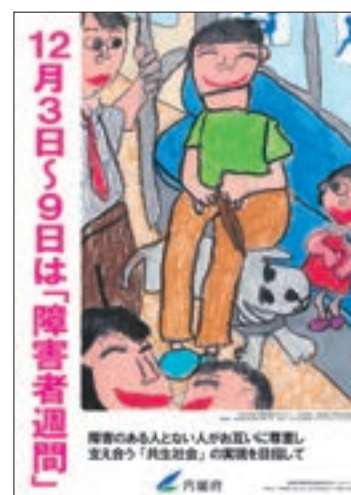
ポスター「障害者週間」

内閣府では、障害者週間の実施に当たり、多様な媒体による広報・周知を行ったほか、障害者週間の取組の一環として、全国から募集した「心の輪を広げる体験作文」及び