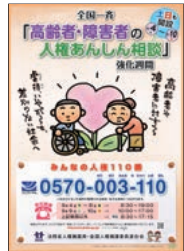
ポスター「全国一斉『高齢者・障害者の人権あんしん相談』強化週間」

法務省の人権擁護機関では、法務局・地方法務局又はその支局において人権相談に応じており、全国共通人権相談ダイヤル「みんなの人権110番」（ナビダイヤル0570-003-110（全国共通））を設置している。また、高齢者に接する機会が多い社会福祉事業従事者等に対し、人権相談を広報するためのリーフレットを配布したほか、老人福祉施設等の社会福祉施設において、入所者及びその家族が気軽に相談できるよう、特設の人権相談所を開設するなどして、相談体制の一層の強化を図っている。さらに、平成29年9月4日から10日までの1週間を「全国一斉『高齢者・障害者の人権あんしん相談』強化週間」とし、平日の相談受付時間を延長するとともに、土曜日・日曜日も開設し、多くの高齢者等からの電話相談に応じた。人権相談等で、高齢者に対する虐待等人権侵害の疑いのある事案を認知した場合は、人権侵犯事件として調査を行い、事案に応じた適切な措置を講じている。