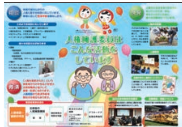
周知用リーフレット 「人権擁護委員 あなたの街の相談パートナー」