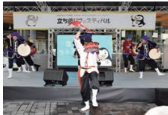
ダルクによるエイサーライブ （「立ち直りフェスティバル」より）

また、平成29年度の第67回の運動における作文コンテストでは、過去最高の33万3,796点の応募があり、作文を書くことを通じて、次代を担う全国の小・中学生に、日常の家庭生活や学校生活の中で体験したことを基に、犯罪や非行のない地域社会づ