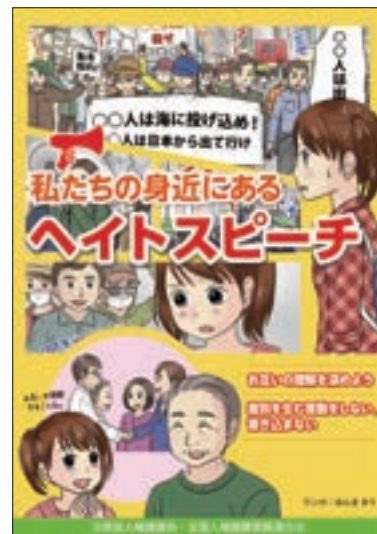
啓発冊子 「私たちの身近にあるヘイトスピーチ」