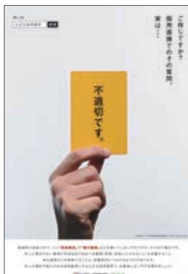
ポスター「ご存じですか？採用面接 でのその質問、実は…不適切です。」