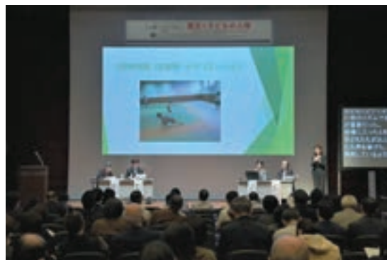
人権シンポジウム「震災と子どもの人権～いま、私たちにできる支援について考える～」(東京会場)

また、東日本大震災に伴って生起する様々な人権問題について対処するとともに、新たな人権侵害の発生を防止