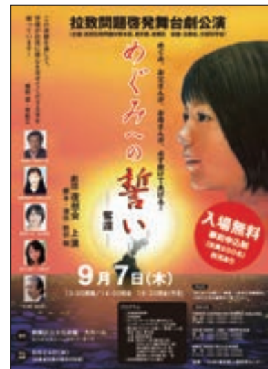
チラシ「拉致問題啓発舞台劇公演「めぐみへの誓い—奪還—」」

拉致問題対策本部は、地方公共団体及び民間団体との共催等による啓発行事として「拉致問題を考える国民の集い」を各都市(福岡市、茨城県水戸市、千葉市、鳥取県米子市、山口市、大阪市)において開催したほか、地方公共団体等と共催で、映画「めぐみ—引き裂かれた家族の30年」の上映会を開催した。また、地方公共団体と共催、法務省及び文部科学省の後援により、拉致問題啓発行事として、舞台劇「めぐみへの誓い—奪還—」を東京都板橋区、佐賀県伊万里市、広島市、秋田県横手市、福井県小浜市、宮城県多賀城市及び沖縄県宜野湾市において上演した。