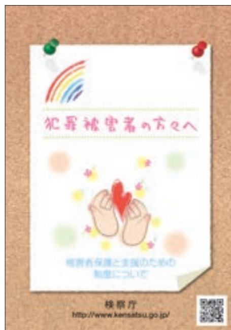
パンフレット「犯罪被害者の方々へ」

このほか、犯罪被害者等への支援活動を行う公益社団法人全国被害者支援ネットワークに加盟している民間被害者支援団体等の関係機関・団体との連携を図りなが