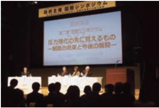
国際シンポジウム「圧力強化の先に見えるもの—制裁の効果と今後の展開」