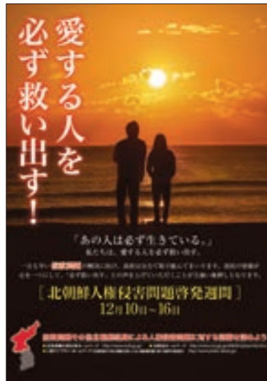
ポスター「北朝鮮人権侵害問題啓発週間」

及び高校生を対象とする北朝鮮人権侵害問題啓発週間・作文コンクールの表彰式を行い、拉致問題担当大臣から受賞者への表彰状の授与及び最優秀賞受賞者による作文の朗読が行われたほか、ミニコンサート（拉致問題対策本部事務局・民間団体共催・北朝鮮向けラジオ放送共同公開収録）を行い、拉致被害者及び北朝鮮による拉致の可能性を排除できない行方不明者の御家族や支援団体等による合唱等が行われた。