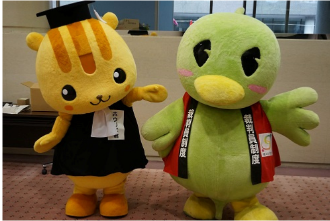
ホウリス君とサイバンインコ

10月7日(土)、法の日フェスタin赤れんがが開催されました。当日は1,600人を超える方々に御来場いただき、模擬裁判や少年院の教育プログラム等を体験していただきました。御来場いただいた皆様、本当にありがとうございました！！