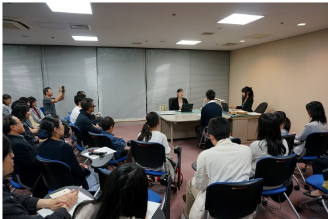
模擬取調べ実演の様子

本物の検察官と検察事務官が模擬取調べを実演しました。 被疑者が罪を認めるまでのやりとりを、皆さん真剣に見入っていました。