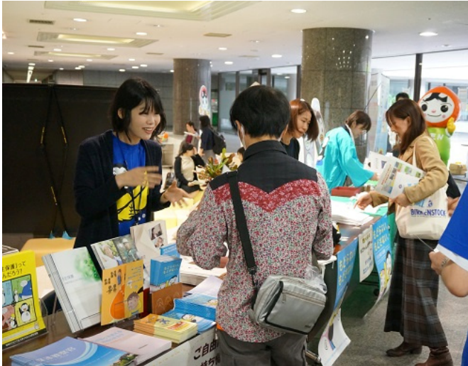
“社会を明るくする運動”についての説明