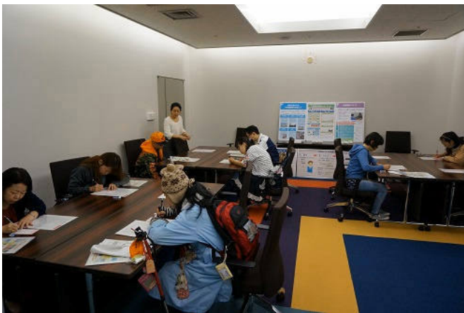
性格検査体験の様子

少年鑑別所で実施している「性格検査」を一般の方向けにしたものを体験していただきました。