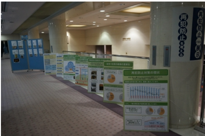
再犯防止パネル展示の様子