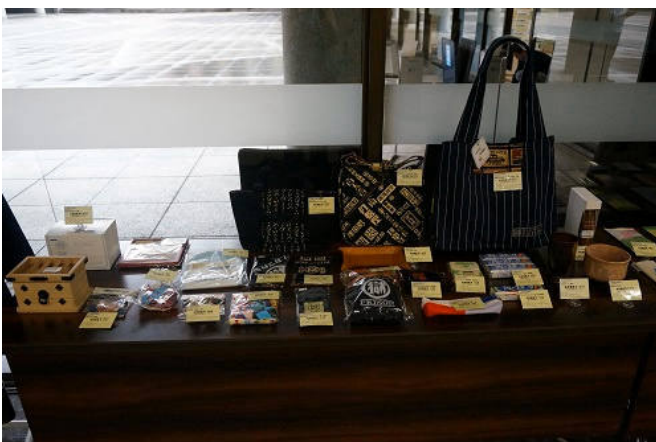
刑務所作業製品の展示・即売

参加者の皆さんにはとても熱心に職員の説明を聞いていただき、またさまざまな質問をしていただきました。