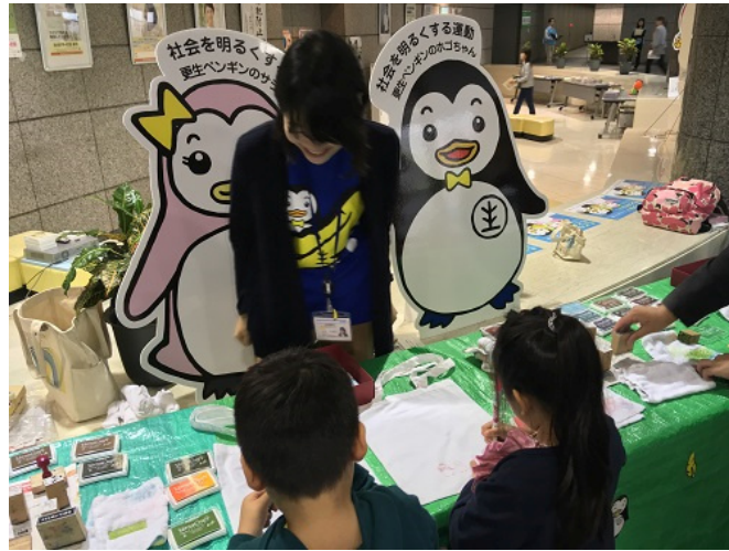
ホゴちゃんとサラちゃんのオリジナルエコバッグ作りの様子