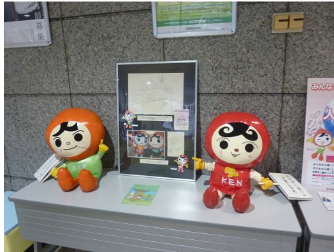
人権擁護局ブースの様子