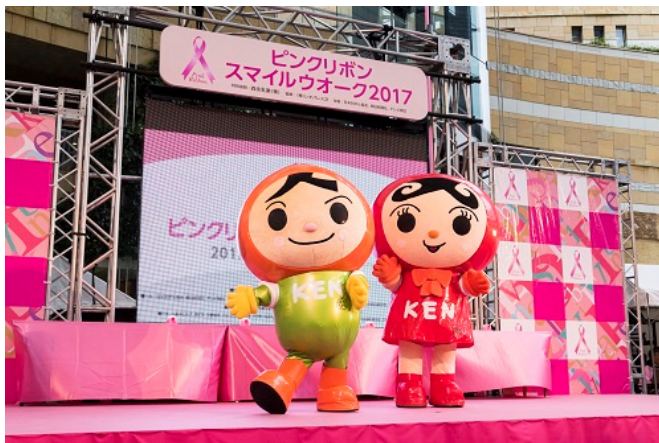
スマイルウォーク出発式の様子

法の日と同日に行われたスマイルウォークの出発式に人権イメージキャラクターの人KENまる君と人KENあゆみちゃんが登場しました！ スマイルウォーク参加者の多くの皆さんにも法の日フェスタに参加していただきました！