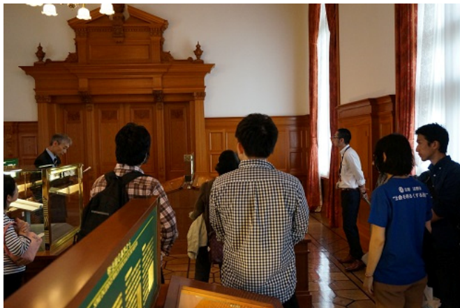
法務史料展示室の様子

法務史料展示室では、法務省に保管されている「司法の近代化」と「建築の近代化」に関する史料等を見ていただきました。