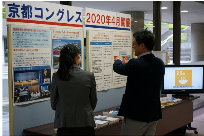
京都コンgres(2020年4月開催)