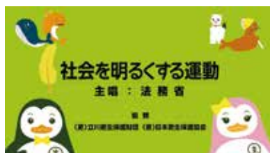
“社会を明るくする運動”CM動画 (法務省YouTubeチャンネルで公開中)