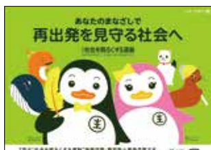
ポスター 「社会を明るくする運動」