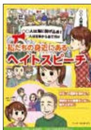
啓発冊子 「私たちの身近にある ヘイトスピーチ」