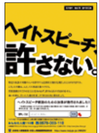
ポスター「ヘイトスピーチ許さない。」