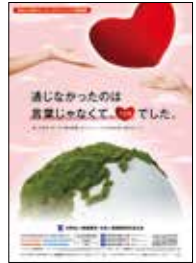
ポスター 「通じなかったのは言葉じゃなくて、心で。」