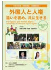
啓発ビデオ 「外国人と人権 違いを認め、共に生きる」