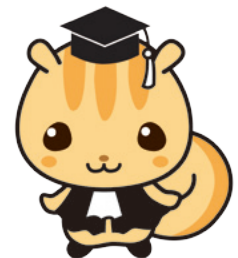
法教育マスコットキャラクター「ハウリス君」

また、資金が残れば他の行政サービスに使用できるため、各町とも、最小限の負担となることを希望している。