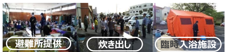
熊本地震における熊本刑務所等による被災地支援の状況

刑務所・少年院・少年鑑別所に関する地方公共団体等の窓口として新たに設置された 法務省東京矯正管区更生支援企画課 (048-600-1560 kouseishien-tokyo@cccs.moj.go.jp) にお問い合わせください。