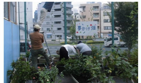
保護観察所における社会貢献活動（花と野菜の栽培）の様子

コラム：刑事施設と地域の専門家が連携した取組 コラム：保護観察所における社会貢献活動の取組