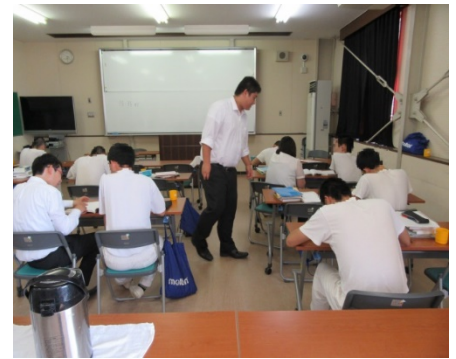
少年院における大学院講師による学習指導の様子