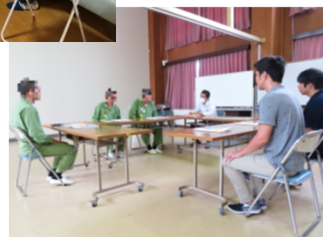
刑事施設の酒害教育の様子