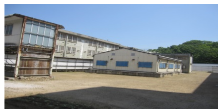
老朽化した刑事施設の外観の様子