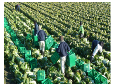
農福連携による取組の様子