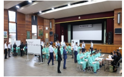
矯正施設の就労支援説明会の様子