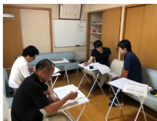
ダルクのグループワークの様子

・保健医療機関や民間団体、地方公共団体と連携した地域社会における支援・治療の継続