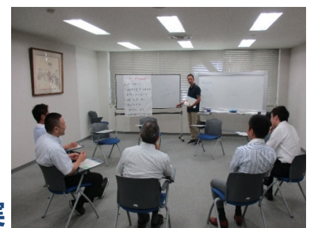
保護観察所の薬物再乱用防止プログラムの様子（イメージ）