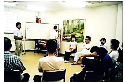
更生保護施設の処遇の様子