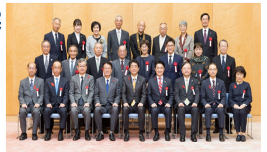
安全安心なまちづくり関係功労者表彰式の様子

コラム：再犯防止を支える民間協力者の取組 コラム：更生保護制度施行70周年 コラム：再犯防止に協力する著名人の取組