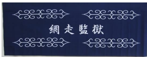
アイヌ文様を取り入れた刑務所作業製品