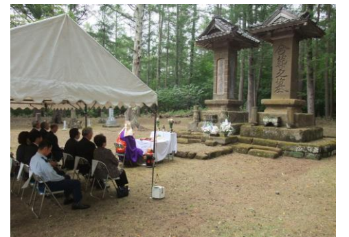
今でも続く北山墓地慰霊祭の様子