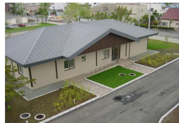
法務少年支援センターさっぽろ

当所は、少年鑑別所法第131条に基づき、「法務少年支援センターさっぽろ」として、青少年の健全育成に携わる関係機関・団体と連携を図りながら、地域における非行及び犯罪の防止に関する活動に取り組んでいます。