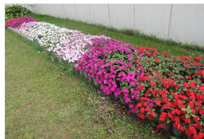
入所した少年が整備した当支所の花壇

・当支所では、思春期の子どもたちの行動理解等に関する知識・ノウハウを活用し、非行のある少年を収容するだけでなく、「法務少年支援センター」として、地域の方々からの非行・犯罪に関する問題の御相談に対応しています。