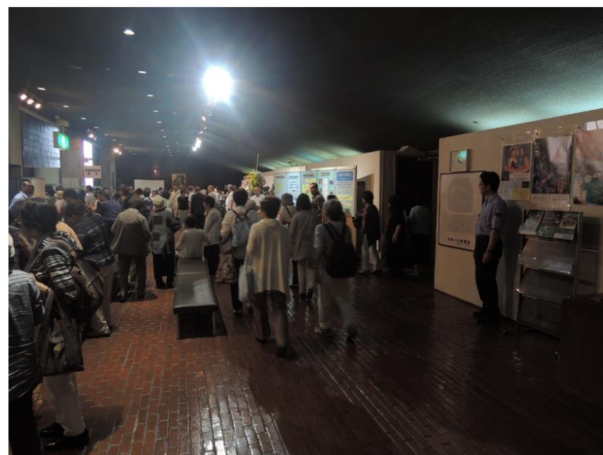
「市民のつどい」の様子

・当支所では、再犯防止活動の一環として、毎年7月、函館地区保護司会主催による「市民のつどい」に参加し、コーナーの一角に少年鑑別所の業務を紹介するパネルを展示するなどして、広報活動を行っています。本年は7月18日に実施しました。