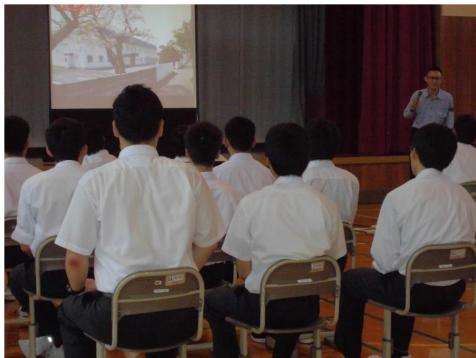
「非行防止教室」の様子

・当支所では、平成22年から函館市内中学校の生徒指導協議会、平成28年からは函館近郊の高校の教護連盟に関係機関として参加するとともに、渡島檜山管内に加えて後志管内の一部（寿都郡、島牧郡）の学校からの依頼を受けて薬物乱用防止教室、非行防止教室を行っております。