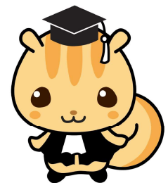
法教育マスコットキャラクター 「ハウリス君」

また、資金が残れば他の行政サービスに使用できるため、各町とも、最小限の負担となることを希望している。