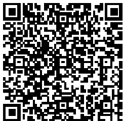
អំពីភ្នាក់ងារហេឡូរើក លេខកូដQR

ដោយឡែក សម្រាប់អ្នកដែលបារម្ភអំពីសិទ្ធិស្នាក់នៅចាប់ពីខែមេសា សូមពិគ្រោះយោបល់នៅមន្ទីរអន្តោប្រវេសន៍ដែលនៅក្បែរលោកអ្នក។