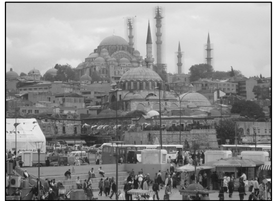
「中央アジア比較法制研究セミナー」とは関係ないが、番外編として

結局、トルコで預けた荷物は一日遅れたが、体は予定どおりに自宅に帰ることができた。