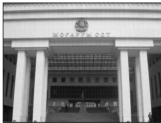
玄関前に正義の女神の像がある。

かなり強烈な女性の裁判官にセミナーの説明をしたが、先方からは、いかに自分がいろいろなセミナーを手がけているか、自分がこのセミナーの講師になりたかったということを語られてしまった。ウズベキスタンの司法省でも同じタイプの女性がいたが、旧ソ連時代から生き抜いている女は強いということだろうか（日本でいえば、「明治の女は強い」みたいな。）。今回のセミナーは、25歳から35歳という年齢制限を設けていたにもかかわらず、カザフスタンは40代、50代の候補者を出してきていたのは、研修員としてではなく、講師としてということだったのかもしれない。カザフスタンは「大国意識」が強いと聞いていたが、まさに「支援をする側」という意識を感じた。