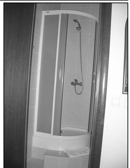
バスルームはこの幅だけ・・・