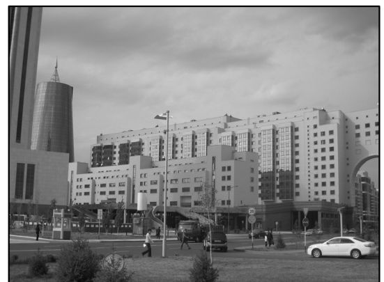
左の円柱の建物はすべて金色

ホテルでは、当然ながら日本円は使えないので、200ドルを両替して、23,200 テンゲになった。ここでの感覚は日本とほぼ同じらしい。廊下のソファとかは、かなり豪華だが、湯船はなく、シャワーは本気で狭い。ここでは、ベッドルームの広さに関心はあっても、バ