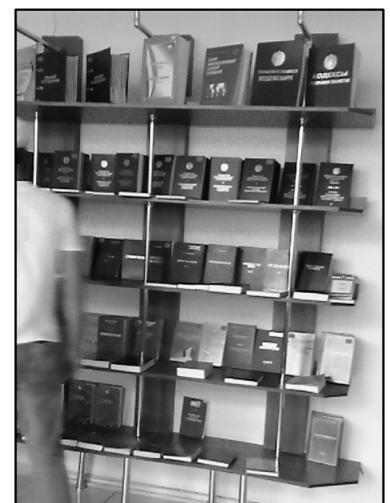
法律の条文集は緑色の表紙に統一されている。

最高経済裁判所の建物1階のキオスク、ホテルに戻る途中の本屋（看板に“法律書”と書いてある。）、司法省の隣の建物の本屋、はす向かいの建物の本屋、すぐ近くのタシュケント法科大学院の本屋を回った。ここで売られているのは、法律の条文（ロシア語＋ウズベク語併記）がほとんどであった。注釈書としては、倒産法注釈書プロジェクトで作成した注釈書、タシュケント法科大学院が作成したと思われる刑法の注釈書（総論・各論のセット）、憲法の注釈書のいずれか1冊があるかないかであった。タシュケント法科大学院の本屋では、企業のための経済法の教科書（コンメンタールではなくてテキスト）があると言われたが、ウズベク語で書かれていると