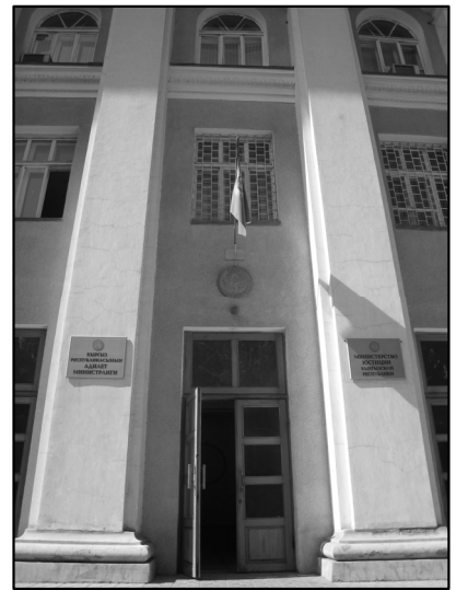
ビシュケク市広域裁判所，チュイ州広域裁判所，司法省が同じ建物に入っている。

女性の所長にセミナーの説明をしたが、所長自身が、いろいろな国への留学、研修、講師派遣の経験があるようで、とにかく話がとぎれない。そして通訳のタイミングも取ってくれないから、話がどこに向かっているのかもわからない。何とか制して通訳をしてもらい、その通訳の終わらないうちにこちらの言いたいことを話し始めないと必要な依頼もできなそうであった。ウズベキスタンの司法省、カザフスタンの最高裁判所でも会ったような、ソ連時代をたくましく生き抜いた年代の女性の特徴なのだろうか。今回のセミナーに自分が行きたかったとのことで、年齢制限は不満といわれてしまったことも、前の二人と共通している。