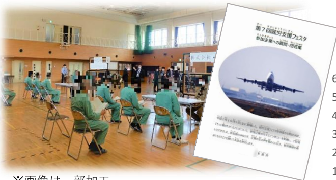
※画像は一部加工 してあります。

今後も感染症対策に配慮しつつ、就労支援と両立していけるよう工夫した取組を行っていきます。