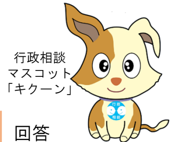
行政相談 マスコット 「キケーン」