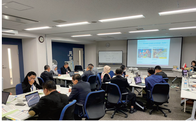
林先生による御講義の様子