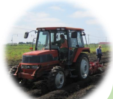
※写真はイメージです。

A 雇用して特に困ったことはないため、今後も雇用していきたいと考えています。また、仕事以外でも、会社の仲間と話をさせるようにしたり、行事に参加させたりして、出所者を一人にさせないようサポートしていきたいです。今は、「仕事中心の生活を長く続けられれば、悪いことに手を染めないのではないか。」と考えています。