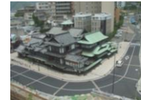
道路整備が実現し、町並み改善、利便性・安全性向上