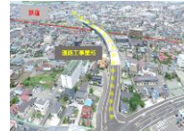
道路整備のための用地取得が円滑に行われ順調に推移