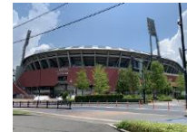
用地買収が加速し、開発工事も大きく進展