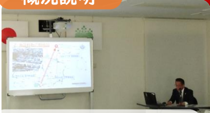
山形刑務所長からの説明