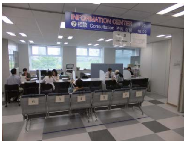
外国人在留総合インフォメーションセンター（大阪入国管理局）

このインフォメーションセンターは、東京入国管理局、同局横浜支局、名古屋入国管理局、大阪入国管理局、同局神戸支局、広島入国管理局、福岡入国管理局及び仙台入国管理局に設置され、英語のほか韓国語、中国語、スペイン語等様々な言語で、外国人の入国・在留に関する手続についての相談に応じている。また、札幌入国管理局、高松入国管理局及び福岡入国管理局那覇支局には相談員を配置し、インフォメーションセンターと同様のサービスを提供している。