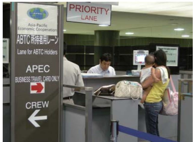
プライオリティレーン