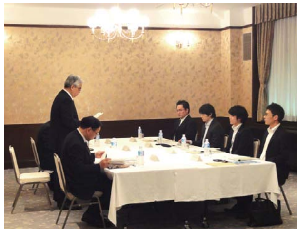
警察・法務・厚生労働三省庁による 不法就労外国人対策の経営者団体への要請