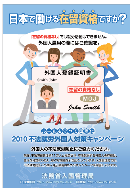
不法就労外国人対策キャンペーン 月間リーフレット表紙

さらに、外国人の雇用を適正化して不法就労を防止するため、毎年6月、政府の「外国人労働者問題啓発月間」の一環として「不法就労外国人対策キャンペーン月間」を実施しており、一般国民を始め、