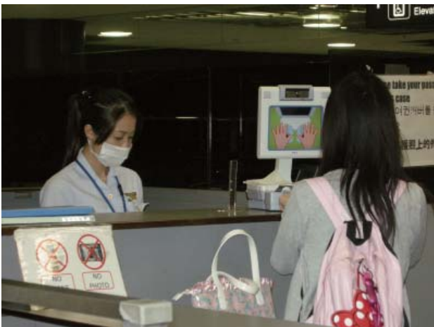
個人識別情報を活用した入国審査風景

他方、個人識別情報を活用した入国審査の実施以降、過去の退去強制歴が発覚するのを避けるため、自己の指紋を傷つけたり手術を受けるなど指紋を偽装して入国を試みたり、こうした手口により偽造旅券を行使して不法入国したと見られる事案が発生した。そのような偽装指紋事案については、入国管理局が退去強制手続を執るだけでなく、刑事処分を含め厳格に対処する必要があることから、警察等捜査機関へ告発・通報を行っているほか、このような事案に対応するため、機器の改修などにより偽装指紋の発見に努めている。