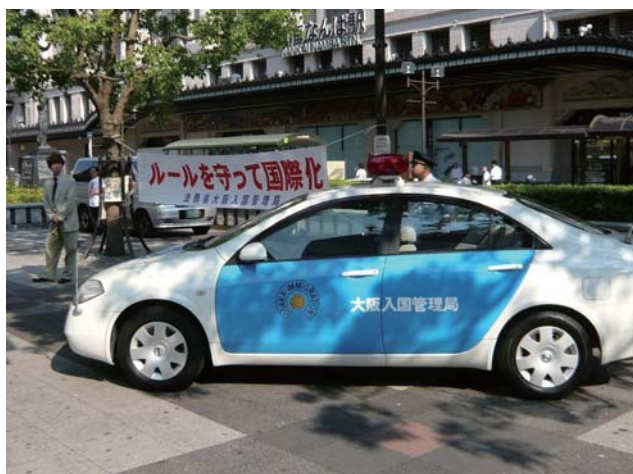
不法就労外国人対策キャンペーン風景