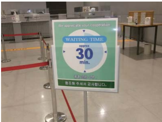
審査待ち時間表示

さらに、円滑な入国審査に資する自動化ゲートの利用希望者登録を促進するため、企業等に赴いて登録サービスを行う「自動化ゲートモバイル出張登録」を行い、自動化ゲート利用希望者への行政サービスの向上に努めている。