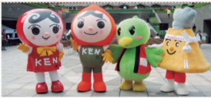
●(左から)人権イメージキャラクターの人KENあゆみちゃんと人KENまもる君、裁判員制度広報キャラクターのサイバインコ(福岡高等検察庁)とかちけん君(鹿児島地方検察庁)もやってきたよ!

会場では、ここでも、「サイバインコ」や「かちけん君」が大活躍で、来場者とふれあうなどして大いに盛り上げてくれました。