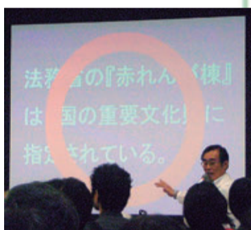
●クイズ検察雑学大辞典の様子

これは、全国各地の検察庁で続々誕生している広報キャラクターのパネルを掲示して来場者に紹介するコーナーで、各庁のキャラクターは、土地土地の名産や歴史上の人物等をモチーフとして誕生した個性豊かな完全オリジナルなものばかり。