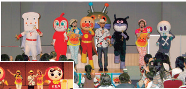
●やなせたかしさんによる「世界をいっしょに」ファミリーコンサートの様子