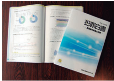
●平成19年版犯罪白書