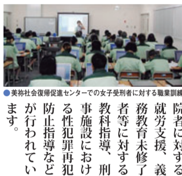
●美祿社会復帰促進センターでの女子受刑者に対する職業訓練

とが再犯の防止に役立つこととなります。また、社会・経済状況等の変化を踏まえ、事案の実態に即した適正な処罰を可能とするため、処罰の範囲や法定刑を変更する各種の立法がなされています。