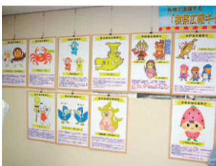
●各地で活躍する検察広報キャラクター紹介コーナー

赤れんが棟では、「クイズ検察雑学大辞典」が行われました。このイベントは、参加者に検察に関する〇×クイズを解いてもらい、見事全問正解した方に豪華景品(?)を贈呈するというものでした。