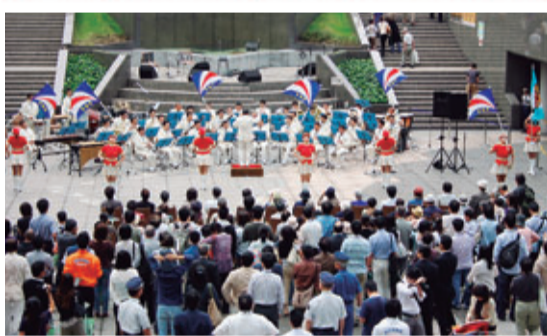
●警視庁音楽隊による演奏と警視庁音楽隊カラーガードのフラッグ演技の様子

サンクンプラザでは、都民と警察を結ぶ「音の架け橋」として幅広い演奏活動を行っている警視庁音楽隊や警視庁音楽隊カラーガード(通称・MEC)が華やかな演奏・演技を披露し、大人気でした。また、「赤れんが秋まつり」のフィナーレとして、