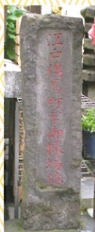
御椽場(刑場)跡の碑

なお、牢屋敷内には刑場も置かれ、死刑の執行もおこなわれていました。現在、大安楽寺境内にある御椽場跡には、供養のための延命地藏尊がまつられています。