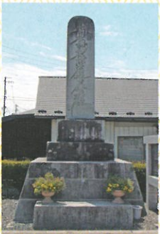
小鷹処刑場供養塔

ところで文化律には、現在の判例と類似の役割を果たした「先例」が収められています。そのなかに、承応2年（1653）6月16日「主人ヲ突殺候下人 於小鷹火罪」と、小鷹刑場にて火あぶりの刑が執行された事実がうかがえます。火罪は放火犯に対する復讐刑（タリオ）としての傾向の強い刑罰ですが、殺人罪に対する刑として用いられたことは、興味深い事例といえるでしょう。刑場周辺に流れていた川は、「罪川」と呼ばれていたそうです（長岡高人編『もおか物語 第4集 -仙北町かいわい-』）。かつての面影はありませんが、周辺のバス停にはその名残がみられます。