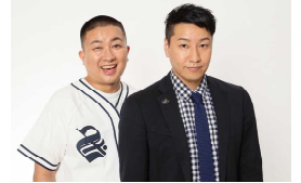
チョコレートプラネット