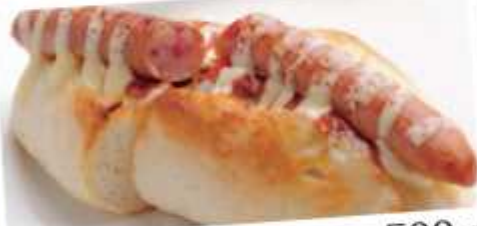
特製ホットドック 500円 Special-made hot dog ソーセージとサルサソースが絶妙にマッチした人気の一品です。