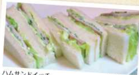
ハムサンドイッチ 500円 Ham sandwiches ロースハムとレタスときゅうりをサンドしました。