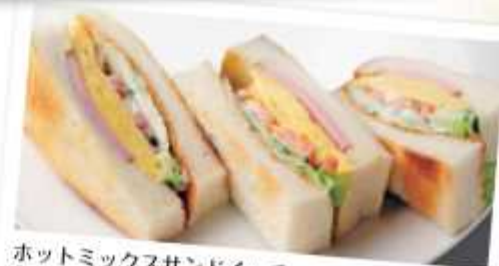
ホットミックスサンドイッチ 550円 Baked mix sandwiches 焼き玉子と厚切りハムをサンドしたサンドイッチです。