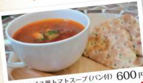
ラタトゥイユ風トマトスープ(パン付) 600円 Potato-cul-de-style tomato soup (with bread) ズッキーニ、ピーマン、玉葱、茄子が入ったトマトスープです。