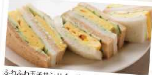
ふわふわ玉子サンドイッチ 500円 Baked egg sandwiches ふわふわに焼きあげた玉子ときゅうりをサンドしました。