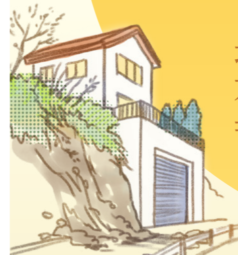
がけ崩れによる 道路の封鎖