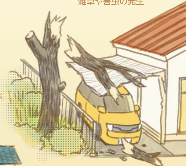
台風や積雪による倒木