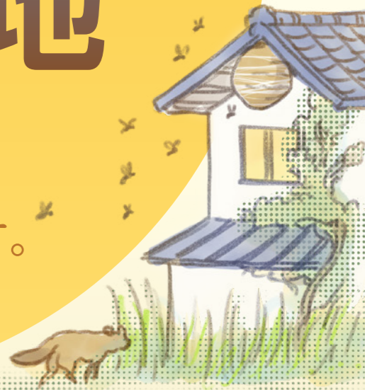
雑草や害虫の発生