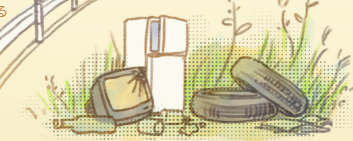
所有地へのゴミ投棄