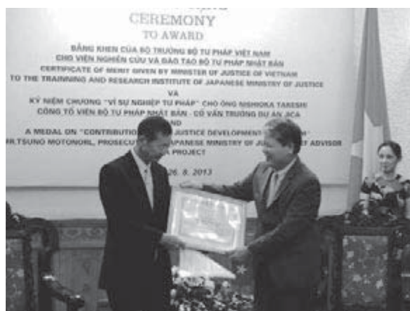
クオン大臣（右）から表彰状贈呈

この後、場所を移して、司法省、最高人民裁判所、最高人民検察院及びベトナム弁護士連合会の各代表者とのワークショップが行われ、いずれの代表者からも、日本の支援・協力活動により大きな成果が得られていること、そのことに対する感謝の気持ち、長期専門家の熱心な活動に対する賛辞などが述べられた。