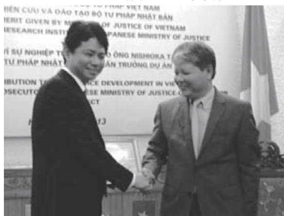
授与後、クオン大臣と握手する西岡前長期専門家（左）