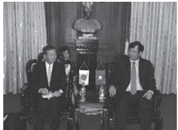
ファン副長官(右)との会談

今回の訪問直前である8月4日から8日までの間、最高人民検察院のグエン・ホア・ビン長官一行が来日し、法務総合研究所訪問、谷垣禎一法務大臣表敬、小津博司検事総長表敬などを行い、日本の法務・検察との関係を親密にしていたため、外国出張中で不在の長官に代わってファン副長官から、これまでの支援協力活動に対する感謝の言葉に加えて、日本訪問から帰国したグエン・ホア・ビン長官も日越の検察の交流を深めていきたいとベトナム国内の関係機関に対して表明したとの話があった。