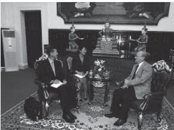
ワッタナ大臣（右端）との会談

会談の中、ワッタナ大臣からは、日本の専門家がカンボジアの民法と民事訴訟法の起草支援を行うに当たり、カンボジアの文化・社会まで踏み込