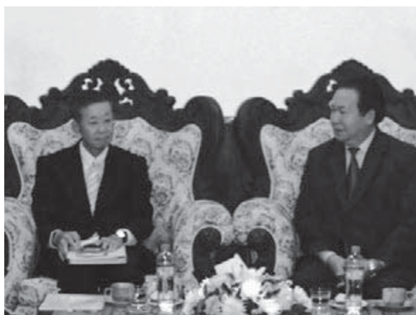
チャルーン大臣（右）との会談

チャルーン大臣は、日本の支援協力活動に対する感謝の気持ち、活動継続に対する強い希望を述べられたほか、ラオスが多数の少数民族を抱えており法の普及の困難性に直面していること、法教育の重要性や法の支配の重要性などにつき熱く語られた。