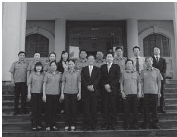
ハイフォン市検察院のメンバーと記念撮影

擬裁判を行う予定であることなどが明らかになり、研修での体験が活用されていることを知ることができた。