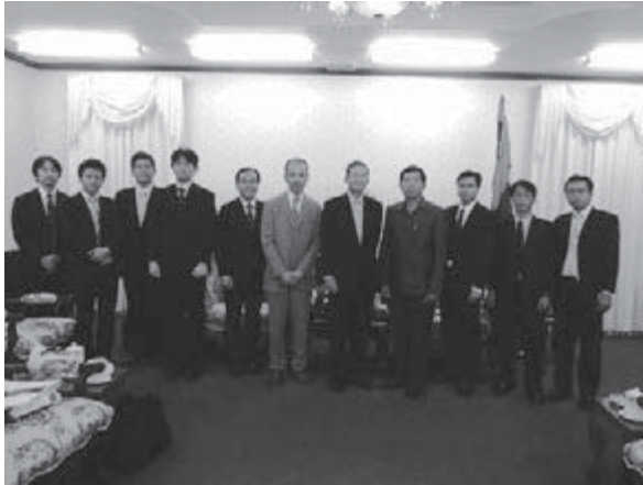
最高人民裁判所のメンバーと記念撮影 (右から4番目がカンパン長官、左から3番目が伊藤浩之長期専門家、同4番目が中村憲一長期専門家)

カンパン長官は、2012年の民事訴訟法・刑事訴訟法改正後、JICAの支援により速やかに法律を印刷して全国の裁判所に配布して研修を行うことができたことが国会で高い評価を受けたというエピソードなどを例に挙げ、JICAを主体とする現行プロジェクトへの感謝の気持ちを述べられた。