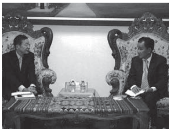
ランシー副長官（右）との会談

ラオスで実施している現行プロジェクトのオフィスは、最高人民検察院の施設内に設置されているところ、ランシー副長官は、副長官御自身が同オフィスに足を向けて長期専門家に質問するなどして活用しているなどという例を挙げて感謝の気持ちを述べられた。ラオスにおいても長期専門家