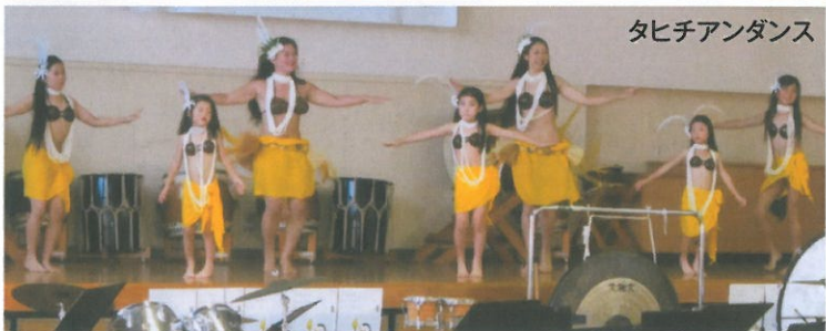
タヒチアンダンス