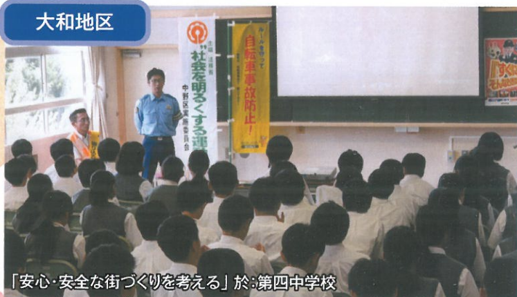
「安心・安全な街づくりを考える」於:第四中学校