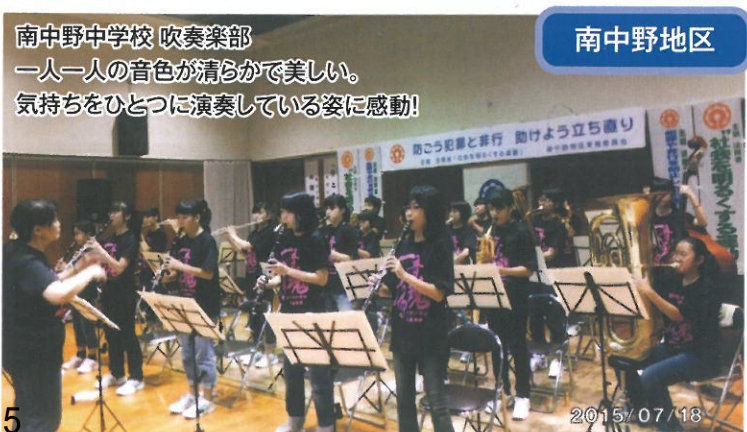
南中野中学校 吹奏楽部 一人一人の音色が清らかで美しい。 気持ちをひとつに演奏している姿に感動!