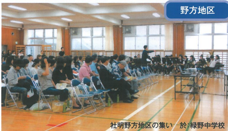
社明野方地区の集い 於 緑野中学校