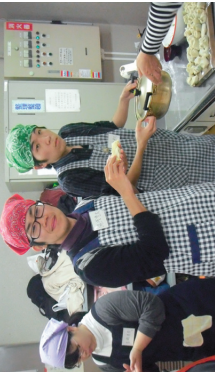
社会参加活動の様子

今は、社会参加活動など、自分が参加できる範囲で積極的に参加しています。様々な人と交流する中で、自分の何気ない行動が相手に喜ばれたり、自分と違う考え方に触れることができたりすることはとても楽しく、嬉しい瞬間です。以前参加したある施設での餅つき大会のとき、活動を終えた参加者一人が私の方にきて「今日はありがとう」と握手をしてくれました。そういった思い出ひとつひとつが、私の活動を続ける理由、モチベーションの源です。