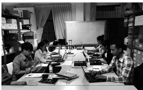
【インターンシップの皆さん（工作中）】

「俺の背中を見て学べ。」と職人気質なことを言うつもりはありませんが、取り繕って良く見せようとしても、結局はボロが出るだけなので、自然体で、ありのままの「背中」を見てもらうことを心掛けています。