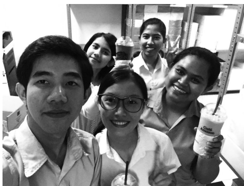
【インターンシップの皆さん（休憩中）】