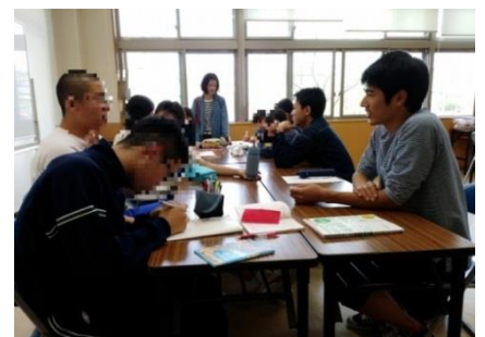
BBS会による学習支援の様子