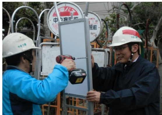
協力雇用主のもとでの就労の様子