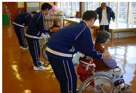
少年院における社会貢献活動の様子