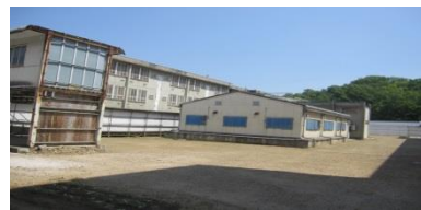
老朽化した刑事施設の外観の様子