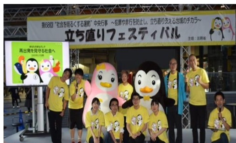
“社会を明るくする運動”の様子