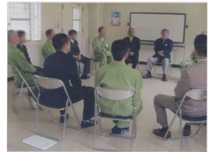
刑事施設における薬物依存離脱指導（グループワーク）の様子

→ 薬物依存症治療の専門医療機関の拡大 → 自助グループを含めた民間団体の活動の促進