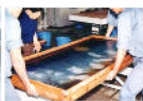
伝統工芸科(和紙工芸)