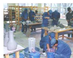
手工芸コース(陶芸)