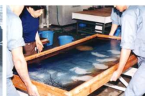
手工芸コース(和紙工芸)