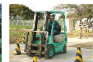
フォークリフト技能講習