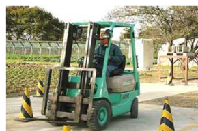
フォークリフト技能講習