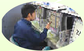
ハローワークによる求職活動

キャリアカウンセラー、ハローワークやコレワークと協働して、就労活動を支援しています。出院後すぐに協力雇用主の下で働くケースもあります。