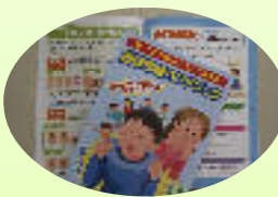
修学情報ハンドブック

中学校や高等学校への復学に向けた調整、転学、入学等に関する情報収集等を行っています。