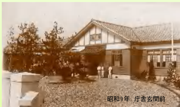
昭和9年 庁舎玄関前