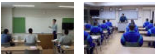
高等学校卒業程度 認定試験