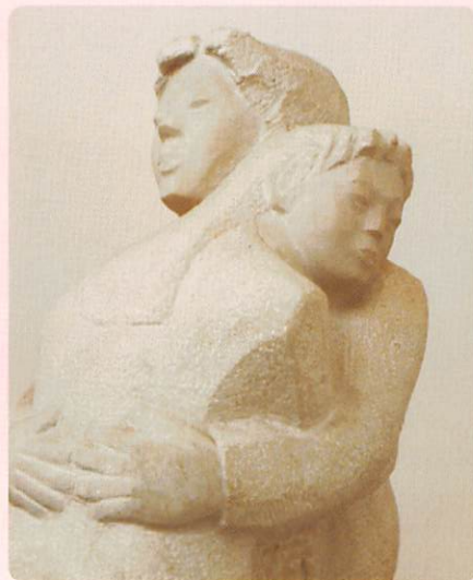
吉田光正氏作「愛に包まれて」