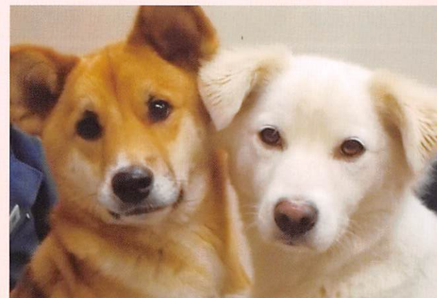
更生支援パートナー犬「ハル」と「ルナ」

HARUNA Juvenile Training School for Girls