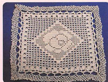
手芸科 レース編み

キャリアカウンセリング 職親プロジェクト 保護者に対する協力の求め 退院者等からの相談