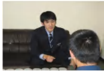
処遇の個別化（個別面接）

少年院 は、家庭裁判所の審判により、保護処分として少年院送致決定を受けたおおむね12歳以上20歳未満の少年を収容し、生活指導・職業指導・教科指導等を中心とした教育・訓練を行い、社会生活に適應できる健全な少年に育成することを目的とした法務省の施設です。