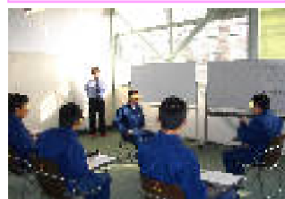
出院準備講座 SST（社会適應訓練）