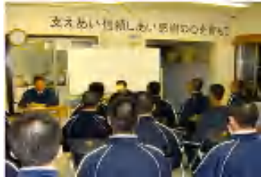
集団生活を通じての 社会化の促進（集会活動）