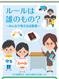
小学生向け 冊子教材(H25作成)