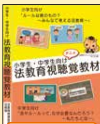
小・中学生向け 視聴覚教材 (H30作成)