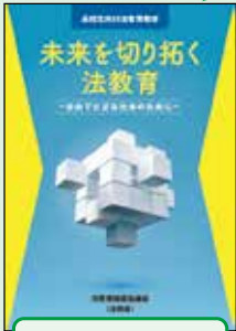
高校生向け 冊子教材(H30作成)