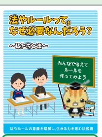
中学生向け 冊子教材(H26作成)