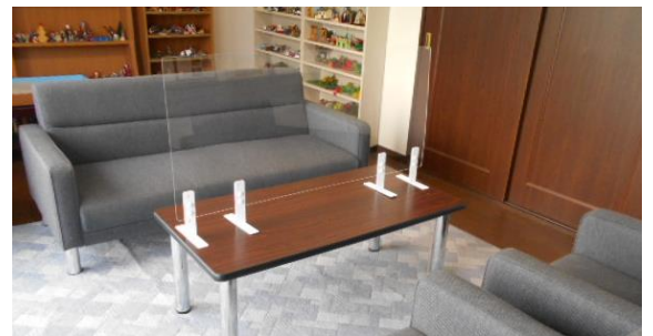
面接室に遮へい板を設置した様子